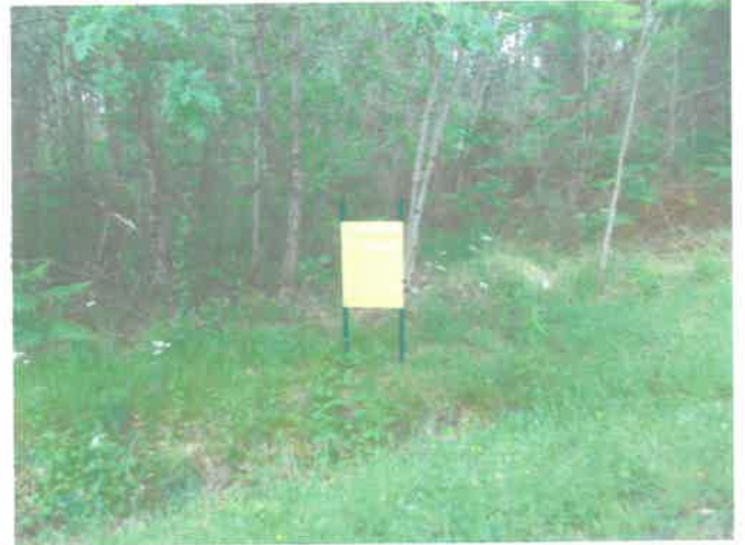
Les affiches sur le terrain